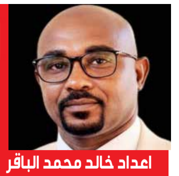
اعداد خالد محمد الباقر