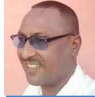
تقرير: نايلة علي محمد الخليفة

ويحرص منسوبي شرطة المرور بالولاية على الاضطلاع بدورهم كاملا تجاه المجتمع من خلال الانتشار الواسع وتطبيق اللوائح والنظم المرورية للحد من الحوادث التي يروح ضحيتها أبرياء.