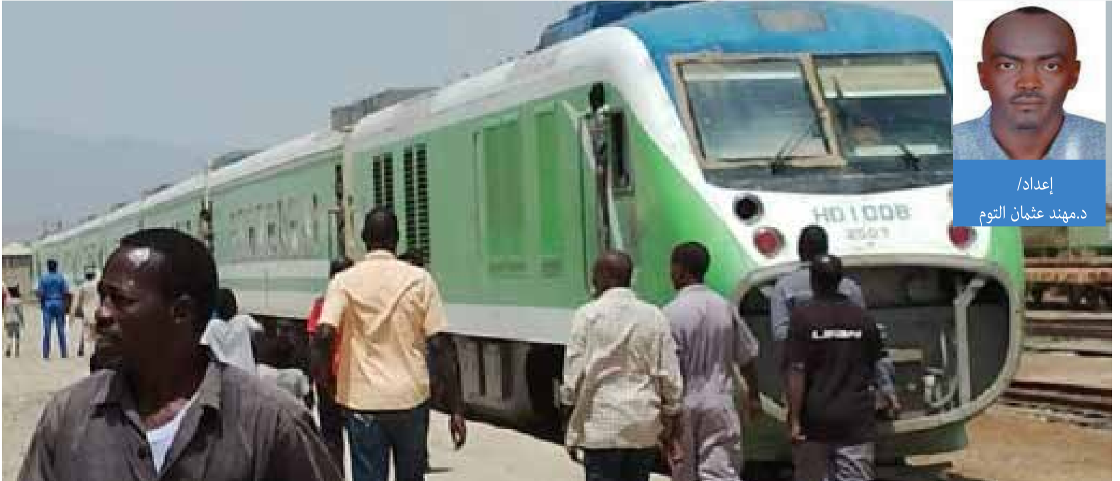
إعداد/ د.مهنا عثمان التوم