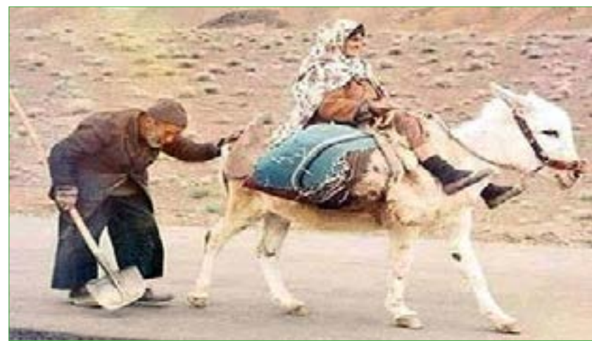
اللهم اجعلنا ممن الأرض بالحسني وممن واشملنا برحمتك يا أدوا دورهم في أعمار عبدوا الله حق عبادته رب العالمين.

الحمد لله الذي جعل الرجل سكنا ولباسا للمرأة كما جعل المرأة سكنا ولباسا للرجل. (جعل بينهما مودة ورحمة) حتى تستمر الحياة في الأرض وحفظ النسل وتكاثرها لاعمارها إلي أن يقضي الله أمرا كان مفعولا. فالإنسان منوط به بتكوين الأسرة وإنجاب الذرية لعمارة الأرض ولعبادة الله سبحانه وتعالى هو ذريته (وما خلقت الجن والانس إلا ليعبدون). كم خلق الحق سبحانه وتعالى من كل الكائنات أزواجا متراحمة ومتواددة كذلك لاستمرار الحياة والتكاثر بينها والتي هي مسخرة لخدمة هذا الإنسان (بني البشر).