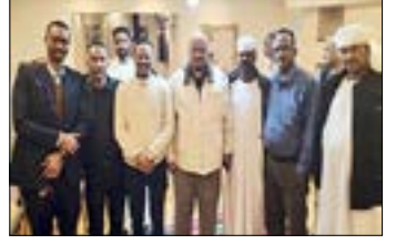
القاهرة - صلاح غريبة

في ليلة رمضان جسدت أسمى قيم التكاتف الوطني، أعلنت «لجنة الأمل للعودة الطوعية» عن دفعة قوية لجهودها الإنسانية، تمثلت في التبرع بثلاث طائرات كاملة لتفويج ونقل السودانيون المحتجزين والرابعين في العودة إلى أرض الوطن.