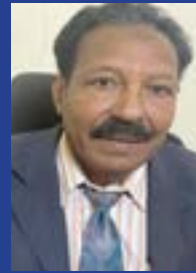
على حسن الريح

وتواكيل مزورة ليس لها أساس من الصحة لتحصل على احكام بالحق الذي أصلاً ليس لهم وليس من حقهم الاستيلاء على حق