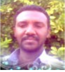
القولد مهيد الخير