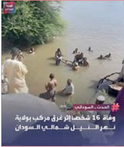
وفاة 16 شخصا إثر غرق مركب بولاية نهر النيل شمالي السودان

* تناقلت الوسائط هذا الخبر المفجع عن غرق (لنش) بمنطقة (طيبة الخواض) بنهر النيل واستشهاد أكثر من ستة عشرة شخص.