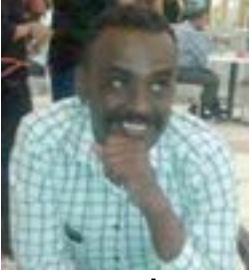
إشراف حافظ دلقو