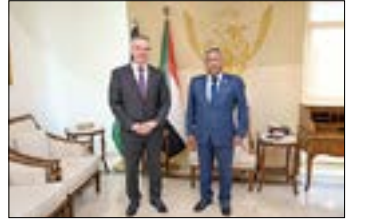
القاهرة - اعلام السفارة

في إطار تعزيز العمل العربي المشترك وتوحيد الرؤى تجاه القضايا المصرية، استقبل سعادة السفير الفريق أول ركن مهندس عماد الدين مصطفى عدوي، سفير جمهورية السودان لدى مصر ومندوبها الدائم لدى جامعة الدول العربية، بمكتبه اليوم الأربعاء، سعادة السفير الدكتور فائد مصطفى، الأمين العام المساعد ورئيس قطاع فلسطين والأراضي