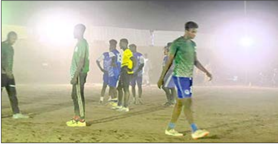
دورة المقاومة الشعبية محلية الدبة الرضائية لكرة القدم

لقطات من المباراة في دورة المقاومة الشعبية محلية الدبة الرضائية لكرة القدم والتي جمعت بين فريقي اللواء 73 الدبة والمقاومة الشعبية