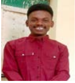
إشراف عوض سالم