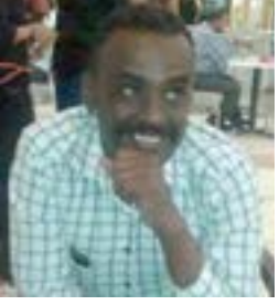
إشراف حافظ دلقو