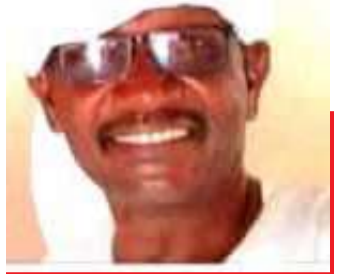
حاوره: أحمد بابكر المكابري

في هذه المساحة نلتقي بالكاتب الصحفي أولاً ثم العميد شرطة ثم المحامي حالياً هو رجل القانون والأدب الذي تخرج من كلية الشرطة وتدرج في الرتب حتى وصل رتبة العميد ومن ثم قدم استقالته بعد حرب طاحنة خاضها الوطن ضد الجنجويد وتجار العملة غادر الشرطة وهو يحمل سيرة ذاتية ناصعة ومن ثم اتجه إلى ميدان المحاماة حيث واصل عطاءه المهني وقبلها عمل بشرطة القصارف تاركا فيها بصمته المعروفة وهو صاحب المثل الشهير الذي أطلق عليه من قبل أهل القصارف الذي ذاع بين الناس (بالنهار ناس المرور وبالليل عبد الشكور)