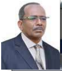
صحيفة النيل الدولية مدارات للناس هاشم عمر السودان