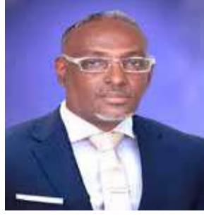
صحيفة النيل الدولية مسارب الضي دكتور محمد تبيدي السودان