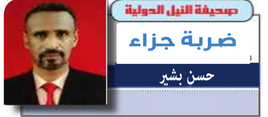
صحيفة النيل الدولية ضربة جزاء حسن بشر

جميع أرواح البشر خالدة ، لكن أرواح الصالحين خالدة و مباركة سقراط