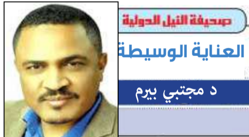
صحيفة النيل الدولية العناية الوسيطة د مجتبي بيرم