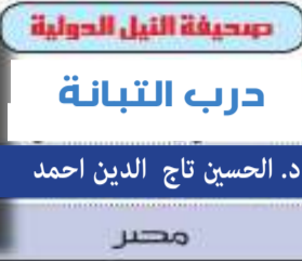
صحيفة النيل الدولية درب التبانة د. الحسين تاج الدين احمد مصر