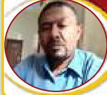
أسامة وداعة الله

يعتصرني الألم عندما أرى الشباب هكذا عرضة لمخاطر الفراغ والبطالة في داخل البلاد وفي بلاد الجوع، ولو جئت احصر تلك المخاطر فلن أستطيع ولكن أخطرها إستغلال فراغهم من قبل تجار السموم من المخدرات والملاهي التي تجعل أمرهم فرطاً، ولذلك واجب علي الدولة أن تشغلهم وتقطع الطريق علي عديمي الضمير علي أولئك التجار، ثم أن الوطن في حاجة لطاقتهم لإعادة الإعمار وبناء مادمرته الحرب، ويجب أن يشكر الآباء والأمهات والله عز وجل والقوات المسلحة علي إجهاض المخطط الصهيوني الاماراتي القحاتي الخبيث الذي كان هدفة تدمير مقومات الوطن وإحداث التغيير الديمغرافي وثم سرقة موارد الوطن، لذلك أول ما إستهدفوا ... إستهدفوا شباب الوطن مثملاً استهدفوا قواته المسلحة ولكننا نعلم تفاصيل تلك المخططات الخبيثة التي حاولوا تمريرها إبان حكومة القحاةة في كل قطاعات الدولة.