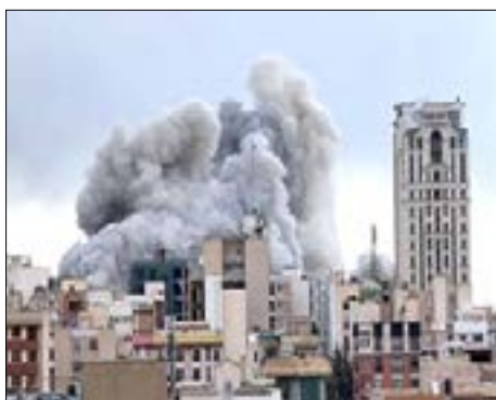
هجوم بصاروخ باليستي إستهدف مجمع الرويس الصناعي بابي ظبي

من جانبها تستخدم أمريكا الآن في قصفها المحموم على طهران المسيرة الإنتحارية (لوكاس) والتي يصل مداها إلى 800 كيلومتر وتستطيع الطيران 6 ساعات متواصلة قبل بلوغ هدفها.. بجانب المسيرة (ام كيو - 9 ريبير)، وهي مسيرة أمريكية هجومية دقيقة تستهدف عادة أهدافاً عالية القيمة مثل الدبابات وتجمعات القوات.. أما المسيرة (غلوبال) الأمريكية فهي مسيرة إستطلاعية يصل مداها إلى 22 ألف كيلومتر. وبعد التهديدات الأمريكية لإيران بأنها إذا لم تفتح خليج هرمز فإنها سوف تضرب جزيرة (خارك) الإيرانية الواقعة في الجزء الجنوبي الغربي للخليج العربي، والتي يصدر منه 90% من النفط الإيراني.. من جانبها رد الحرس الثوري الإيراني على التهديد الأمريكي بقوله: «إذا هاجمت أمريكا