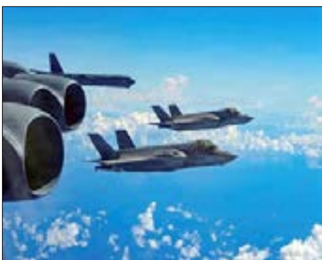
طائرات قتالية أمريكية في طريقها لضرب أهداف إيرانية داخل طهران

أما إسرائيل فاشهر صواريخها صاروخ (رامبيج) الفرط صوتي (جو - جو)، والذي يسمع صوت إنفجاره في الهدف واضحا على الفضائيات الناقلة للحرب خاصة (سي إن إن) الأمريكية، بجانب صاروخ (بلو سبارو)، وهو فرط صوتي.. وتتراوح سرعات