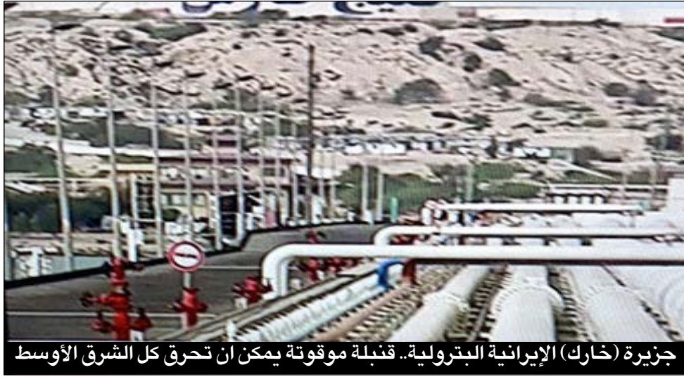
جزيرة (خارك) الإيرانية البترولية.. قنبلة موقوتة يمكن أن تحرق كل الشرق الأوسط

ووفقاً لمركز الدراسات الإستراتيجية والدولية (سي سي إي) فإن العمليات القتالية الجوية والبحرية تمثل الجزء الأكبر من الإنفاق العسكري في الحرب الحالية، وتقدر الكلفة اليومية للعمليات الجوية بنحو 30 مليون دولار في حين تصل كلفة العمليات البحرية إلى 15 مليون دولار يومياً، والعمليات البرية - إذا استخدمت - تصل تكلفتها إلى 106 مليون دولار يومياً.. أما من حيث تكلفة الأصول العسكرية المستخدمة في الحرب فيشير التقرير أن أبرز النفقات تتمثل في تشغيل طائرات التزود بالوقود والنقل العسكري التي قد تصل كلفتها إلى نحو 9 ملايين دولار يومياً، بجانب حاملات الطائرات والدمرات الحربية والمقاتلات خاصة النوع المعروف بـ(الشيخ).. بين بينما يرى المدير الأكاديمي، كينيث سميتز، من جامعة بنسلفانيا الأمريكية: «إذا إستمرت حرب الشرق الأوسط الحالية لشهرين فيمكن أن تصل تكلفتها إلى (40 95) مليار دولار، وذلك في حالة إرسال قوات برية إلى الداخل الإيراني.