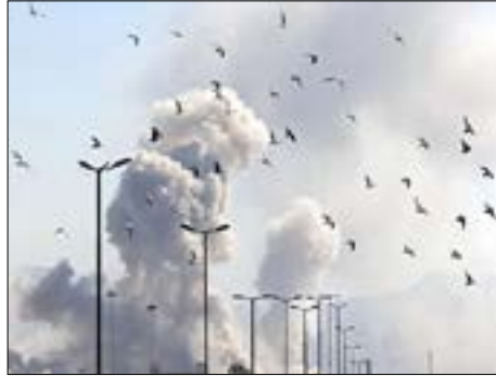
الطير الهاربة من حريم طهران بسبب القصف الأمريكي الشرس