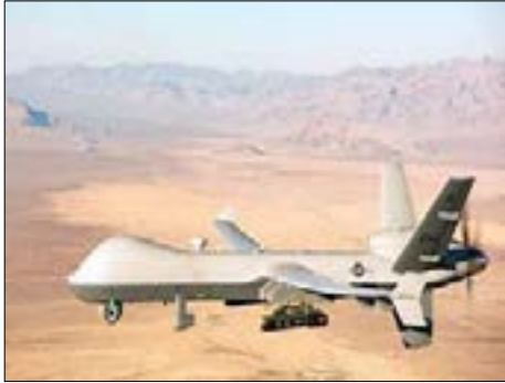
ريبار.. المسيرة الأمريكية الأعلى في العالم